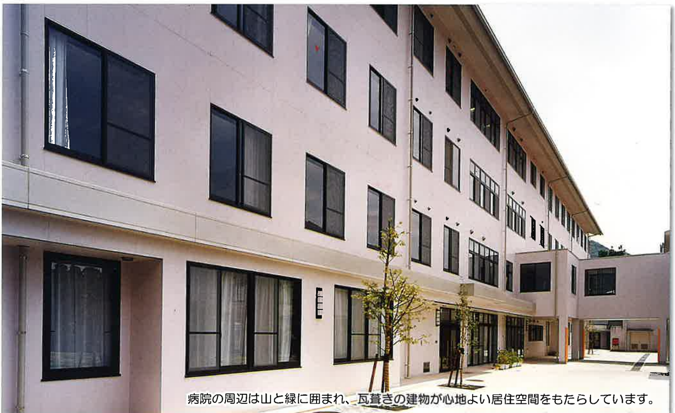
病院の周辺は山と緑に囲まれ、瓦葺きの建物が心地よい居住空間をもたらしています。