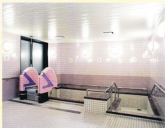
搬送車のシートに着床したまま、シート部だけが分離し、電動でスムーズに昇降します。