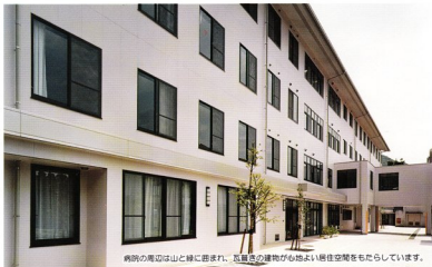
病院の周辺は山と緑に囲まれ、瓦葺きの建物が心地よい居住空間をもたらしています。